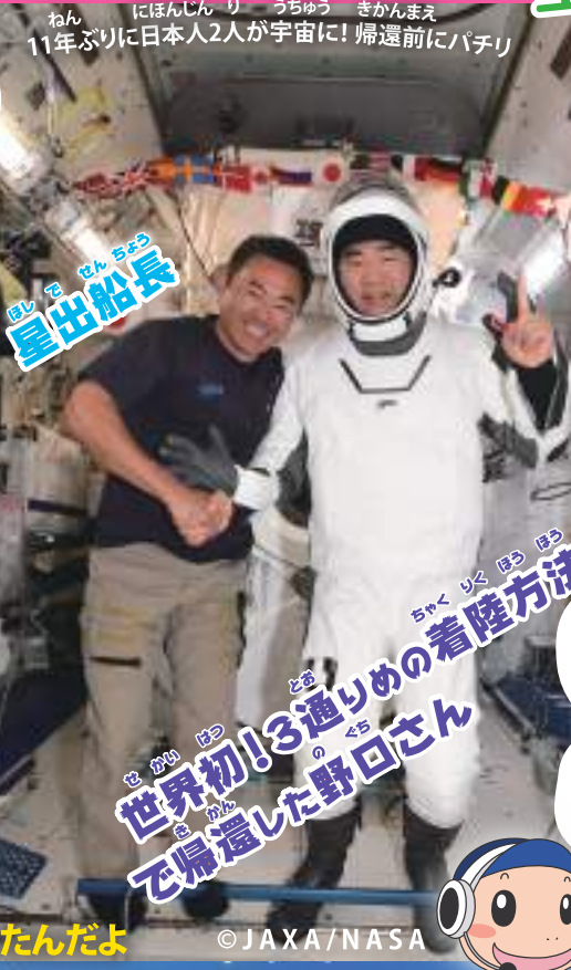
11年ぶりに日本人2人が宇宙に! 帰還前にパチリ

2021年4月23日に宇宙へ飛び立った星出宇宙飛行士は、現在、日本人として2人目の国際宇宙ステーションの船長を務めているよ!