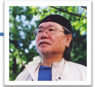
YAC 理事長 松本零士氏

宇宙飛行士が大使を務め、当館の名誉館長・松本零士氏が理事長を務める全国組織です。全国100以上の分団があり、宇宙や科学に関する活動を行っています。