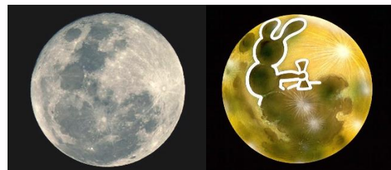
満月の模様 ウサギのもちつき（日本）