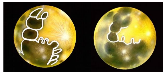
カニ（中国） 女の人（ヨーロッパ）