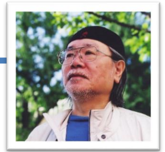
YAC 理事長 松本零士氏

宇宙飛行士が大使を務め、当館の名誉館長・松本零士氏が理事長を務める全国組織です。全国100以上の分団があり、宇宙や科学に関する活動を行っています。