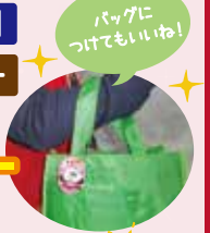
バッグにつけてもいいね!

★時間/各日13:00~16:00 ★会場/展示・体験室前 ★参加料/100円 ★定員/各日200人(当日先着順) ★参加方法/時間内に直接会場へお越しください。