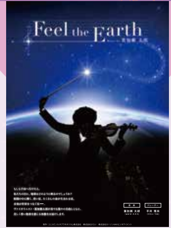
制作:コニカミルタプラネタリウム館/朝さらい/横ロ-ソフHMVエンタテインメント

高度400kmに建設された宇宙に浮かぶ「国際宇宙ステーション・ISS」。私たち人類は、地球をめぐる人工の島を完成させました。ここから見る世界最高の眺望は、どのような景色なのでしょうか。青く輝く地球、都市の夜景、宇宙から見下ろすオーロラ…。人類が作り上げたこの絶景ポイントからの眺めを、プラネタリウムで大迫力の映像をご家族そろってお楽しみいただける番組です。