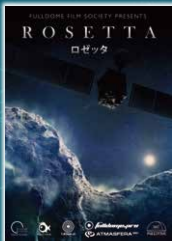
配給: FullDome Film Society / AltairLLC

ロゼッタは、ESA(ヨーロッパ宇宙機関)の彗星探査機です。打ち上げから10年の歳月をかけて、チュリモフ・ゲラシメンコ彗星に到着し、これまでにないリアルな彗星の姿を観測しました。さらには、着陸機「フィラエ」を降下させ、その活躍が広く知られています。彗星の成り立ちや観測の歴史などを、彗星発見者クリム・チュリユモフ氏の話をお紹介いたします。